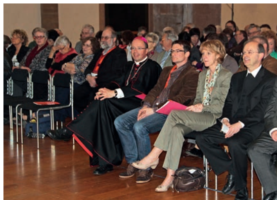
Frauen und Männer aus dem ganzen Bistum waren nach Trier gekommen, um sich über die Synode zu informieren und miteinander zu diskutieren.

Die kirchlichen Strukturreformen der letzten Jahre, weniger haupt- und ehrenamtlich Engagierte, zurückgehende finanzielle Ressourcen und die zurückgehende Katholikenzahl auch aufgrund des demografischen Wandels hätten den „Ruf nach Inhalten“ immer lauter werden lassen, erklärte der Bischof einen Hintergrund für die Ausrufung der Synode. Es gelte, sich neu darüber auszutauschen, „was uns als Christen bewegt und was uns trägt“, sagte er.